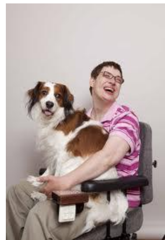
Figuur 1: Persoon met een beperking wordt blij van het bezoek van een therapiehond