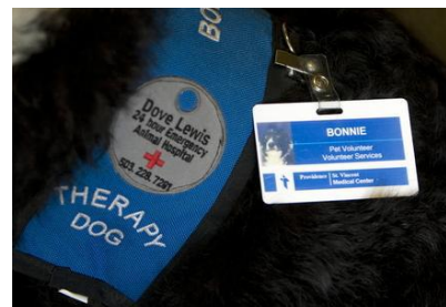
Figuur 2: Identificatie van een therapiehond

Bij Animal Assisted Therapy worden de dieren geselecteerd op nog strengere eisen. Het karakter van het dier moet aansluiten bij het karakter van de cliënt en bij de doelstellingen van het therapieprogramma. Het is heel belangrijk dat de veiligheid van zowel de cliënt als het dier gegarandeerd kan worden (Chandler, C. 2001).